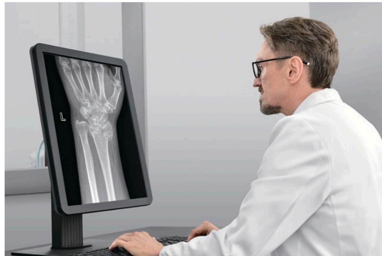
Monitor de diagnóstico para un diagnóstico más sencillo