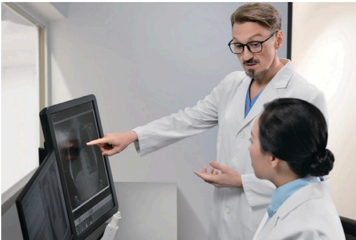
Flujo de trabajo humanizado para una operación fluida