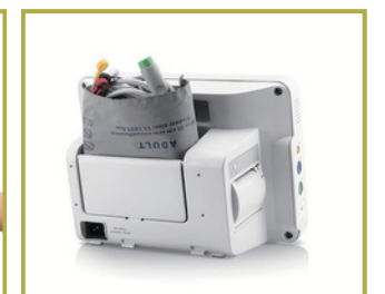
Gabinete exclusivo para accesorios