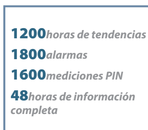
Enorme capacidad de datos