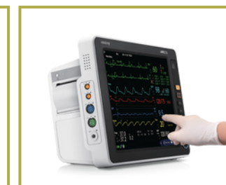
Interfaces fáciles de usar