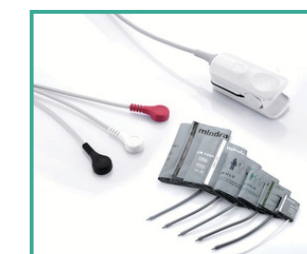
Accesorios de alta calidad