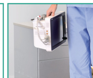
Protección contra caídas