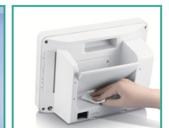
Compatible con múltiples agentes de limpieza

VENTA DE EQUIPO MÉDICO Polymedic Tecnología al servicio de la salud