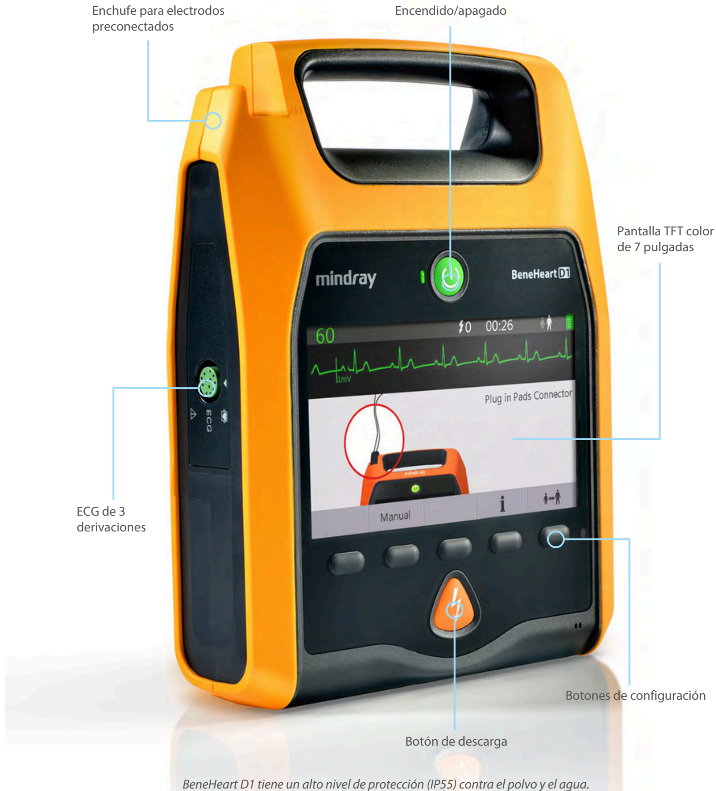
BeneHeart D1 tiene un alto nivel de protección (IP55) contra el polvo y el agua.