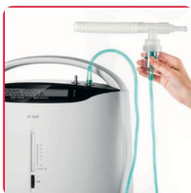
MODO CONCENTRACIÓN DE OXÍGENO